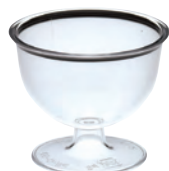
樹脂カップ プチワイン

19-252-02(32472) 40円 約φ5.5×H3.6cm ※PS(ポリスチレン)